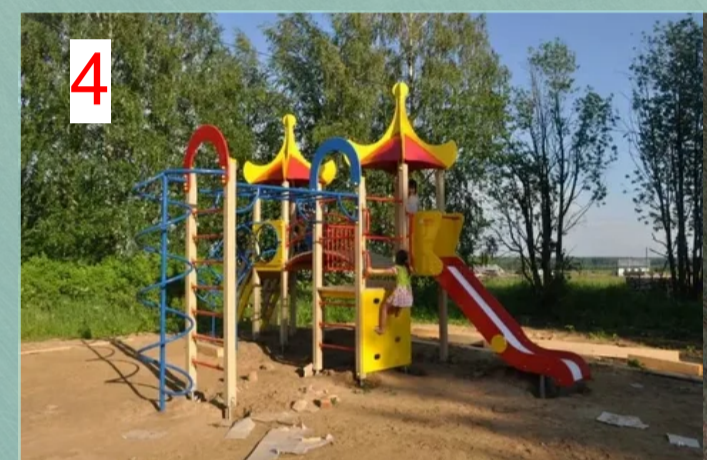
Детская игровая площадка