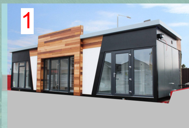
Торговый объект с комплексным приемным пунктом