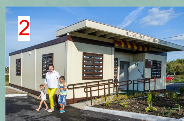
Фельдшерско-акушерский пункт с аптекой