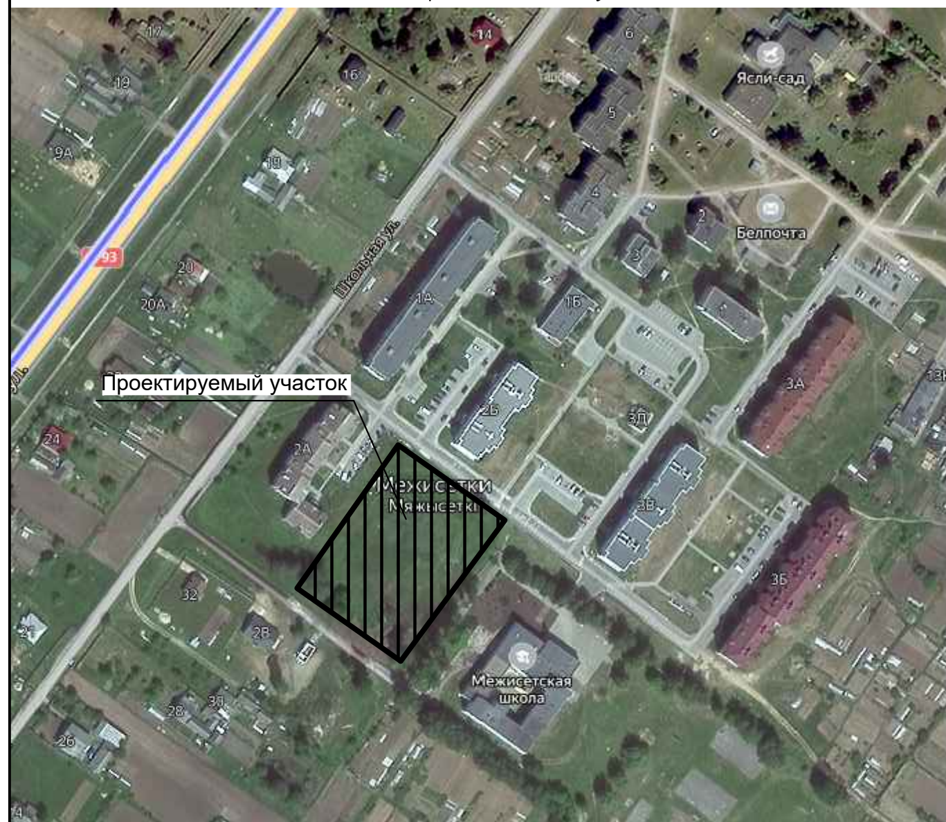
Схема размещения участка

Проект предусматривает эффективное использование участка, высокий уровень благоустройства и озеленения. Объект обеспечен удобными пешеходными и транспортными связями, решение способствует комфортному передвижению жильцов квартала по дворовой территории и не препятствует эпизодическому передвижению автотранспорта (такси, разгрузка личных вещей из автотранспорта, проезд пожарных машин, машин скорой помощи, коммунальных служб).